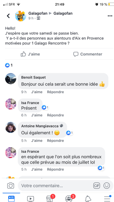
Figure 3. Capture d'écran de commentaires Facebook du groupe Galagofan

« Et tout ça, sous l'égide Galago, sous le drapeau de Galago. Alors qu'en fait, ils pourraient faire juste une rencontre entre eux. Mais ce qui me flatte – parce que quand même j'ai toujours besoin de me rassurer – c'est d'avoir cette bannière Galago qui est comme référentielle [...]. »