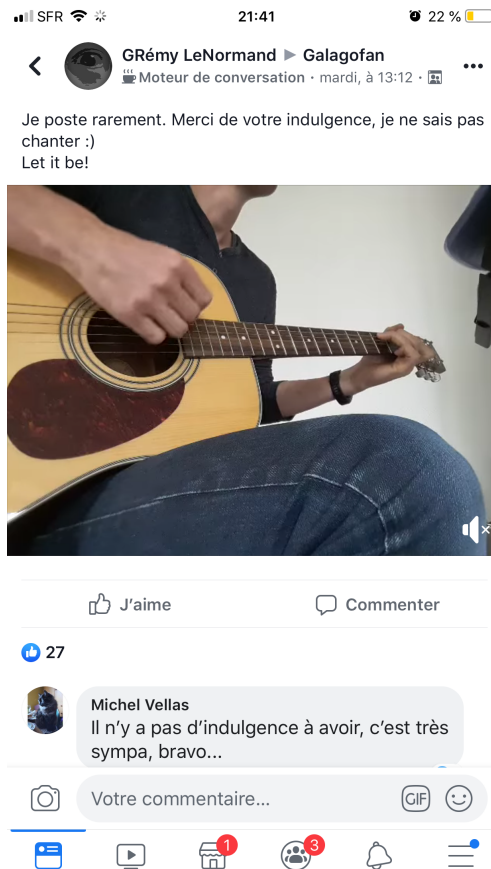
Figure 2. Capture d'écran de commentaires Facebook du groupe Galagofan